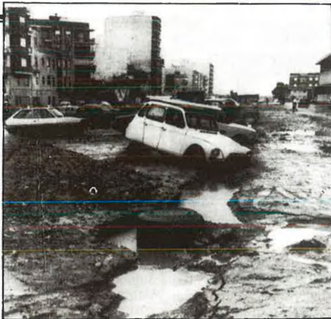
Així queda la Ribera

fetes pels afectats. Se'n foten de l'autonomia real que les associacions de damnificats mantenen respecte a qualsevol partit. El que en ells és virtut (pacte explícit amb AP per mantenir l'Estat espanyol dins de l'OTAN; anit mateix, gràciosa concessió a AP de la collonada de limno , etcètera), en qualsevol altra força política que coincideca en la defensa del que creuen just, és un pecat nefand. Però la cosa encara és més grossa perquè el ple de l'Ajuntament d'Alzira del 30-3-84, va aprovar per unanimitat (AP i PSOE, inclosos) una sol·licitud d'ampliació dels termes crediticis als damnificats per les inundacions, que arreglava en essència les mateixes reivindicacions que hui han tret els afectats una altra volta al carrer. En sis mesos el PSOE