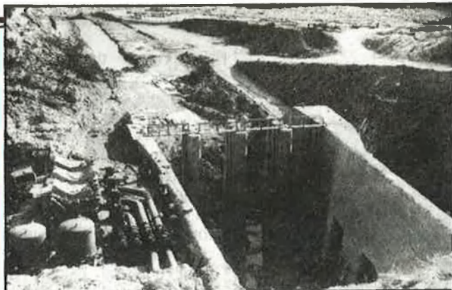
La presa de Tous, causa principal de la catàstrofe

tec i interessos siga congelat, i es garantezca que no s'emprenrà cap acció de força contra els damnificats.» Aquestes són les dues reivindicacions que els afectats valoren com a irrenunciabls.