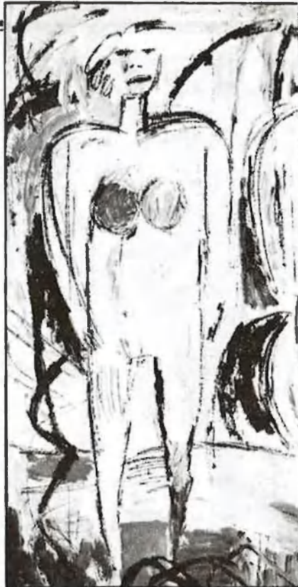
«Dona», de Josep Sanleón

Horari d'oficina 9.30 a 1.30 i 5.30 a 9.30 Tel. 361 22 04