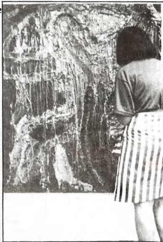
«Lluita», d'Evarist Navarro