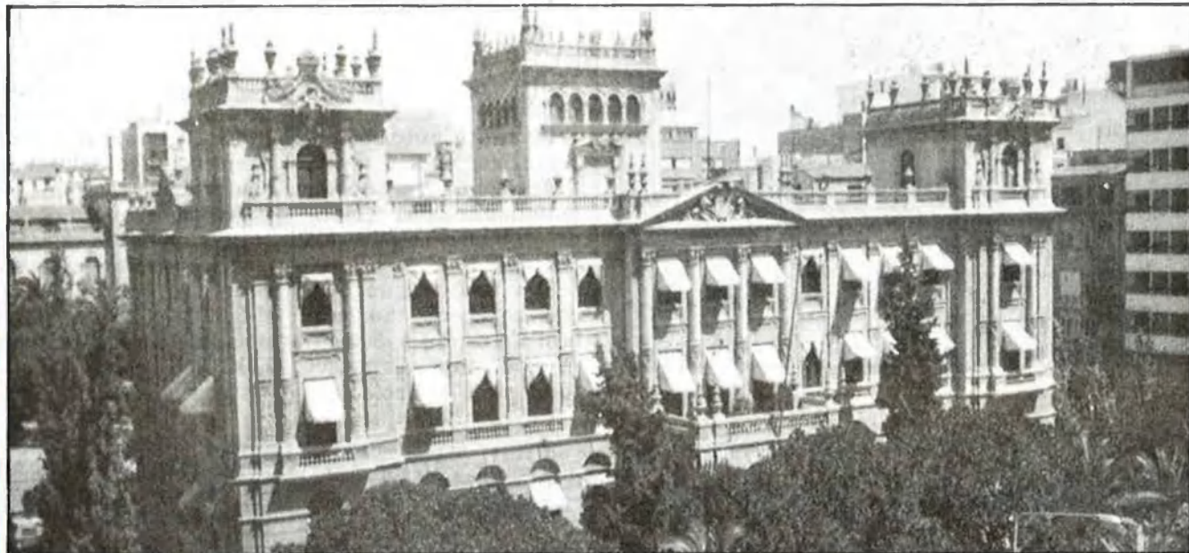
La Diputació, centre polític de l'administració «provincial»