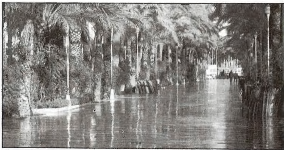
La ciutat d'Alacant sempre ha mantingut suspicàcies cap a València

ens faça més lliures com a poble. Valencianitzar-se és arraconar tot tipus de consciència aberrant com el provincianisme, l'anticatalanisme, l'enfrontament Alacant-València. I en aquest projecte tenen un paper determinant les comarques, sobretot les ciutats intermèdies, que poden balancejar el pes social de dues ciutats germanes que gent tèrbola volen barallades.