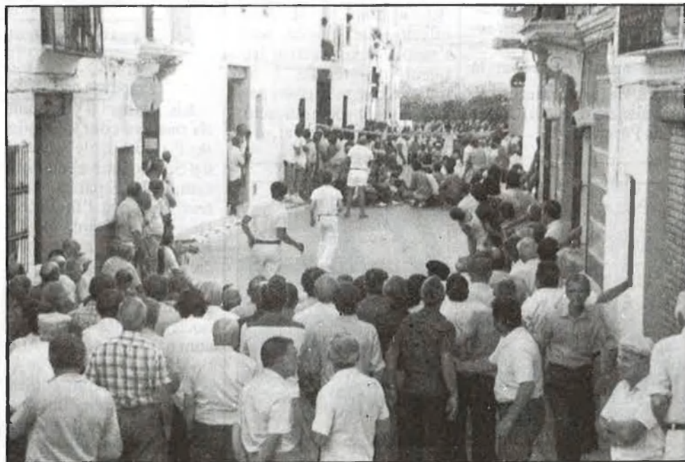
La pilota valenciana necessita autonomia federativa.

Nous estatuts i nova Federació... que ja tarden massa