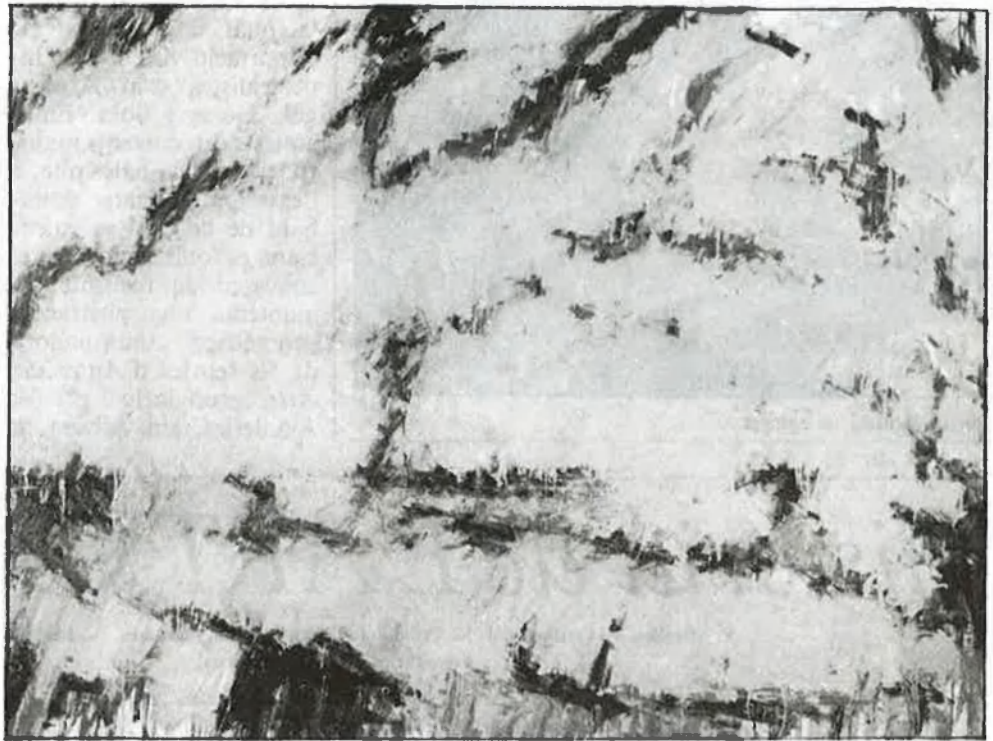
«En el jardí», oli sobre tela, de Jordi Teixidor

Entre el realisme i la figuració (1982) resulta un model a imitar. Molt prompte, altres iniciatives —a Pontevedra, Sevilla,