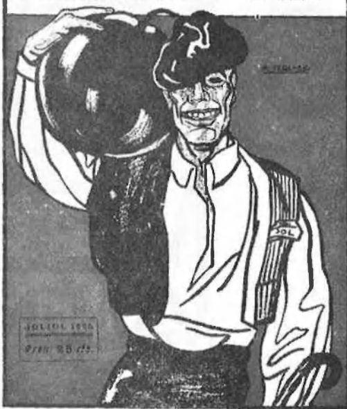
Coberta de la revista Pensat i Fet , per a la Fira de Juliol, de València, del 1923