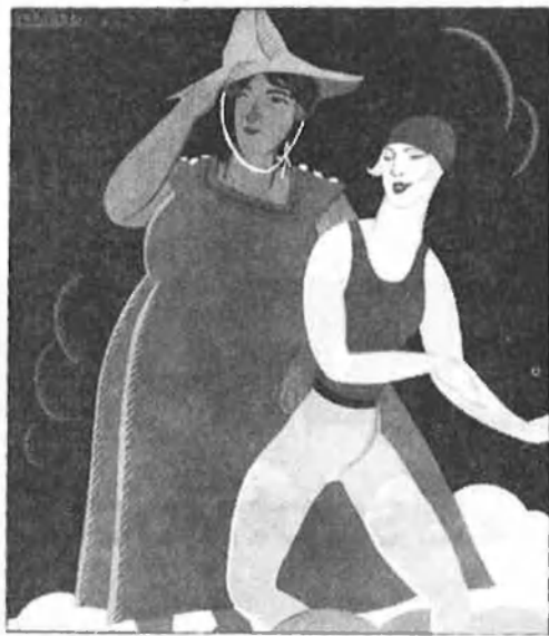
Coberta de La Semana Gráfica , on Vercher col·laborà assíduament