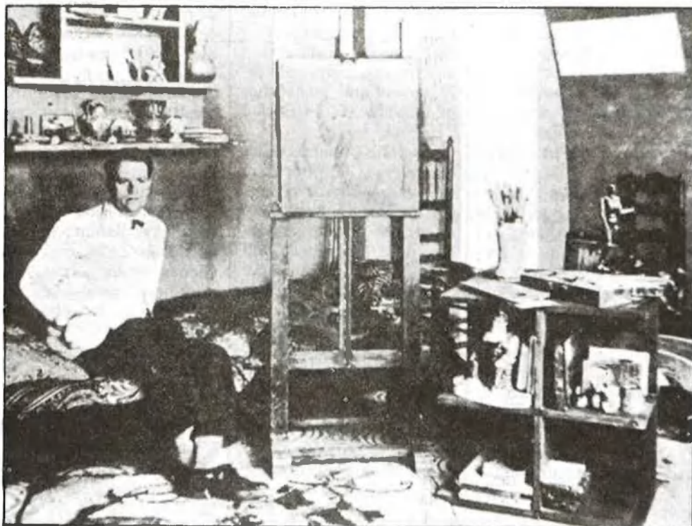
El pintor, en el seu estudi