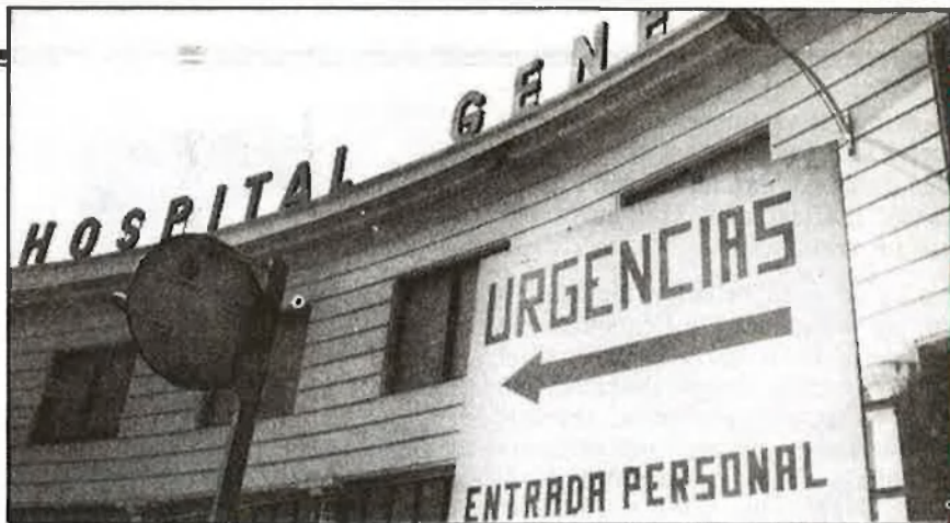
Els hospitals públics contra els bancs privats de plasmafèresi

El transeünt conta, també, que en algun dels hemobancs quan estàs dèbil donen sobres amb continguts vitamínics, «i així pots punxar cada dia. Això és un negoci per a tota la vida, perquè, mentre hi haja atur, és l'única manera de traure't quatre mil pessetes a la setmana; de totes formes, també hi ha molts que prefereixen anar a punxar perquè s'estan de pispar».