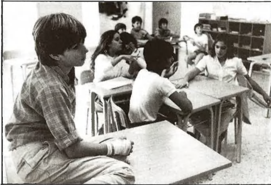
L'educació absorbeix una bona part del pressupost