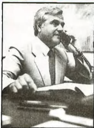
Francisc i Ciscar

La lluita entre famílies polítiques és també la lluita per la possessió de les dades