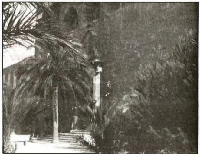
Cal adaptar l'illa als condicionaments imposats pel turisme

L'alcalde de Tabarca confia que l'Ajuntament d'Alacant i la Generalitat Valenciana construiran un nou port