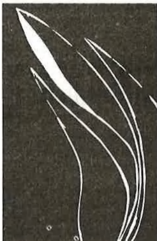
(De dalt a baix) Obres de Julian Schnabel, Eric Fischl i Donald Sultan

«El conductor borratxo». Bill Jensen (1945) ens hauria decebut amb la seua obra gràfica si no tinguésem cap notícia de la bellesa lumínica dels seus «trentats» pictòrics, i el mateix s'hauria de dir de Susan Rothenberg (1945), l'obra de la qual ha servit tant de referència per als qui volen estar a la moda. El figurativisme d' Eric Fischl (1948) no és sinó el pretext temàtic per a la demostració de la qualitat de la seua pintura. Donald Sultan (1951) podia haver deixat millor record en els espectadors valencians si hi hagués enviat els seus olis, ja que en l'obra gràfica queda excessivament fred. Per últim, els aiguaforts i aiguatintes de l'escultor Bryan Hunt (1947) constitueixen —al meu parer— l'aspecte menys significatiu del conjunt.