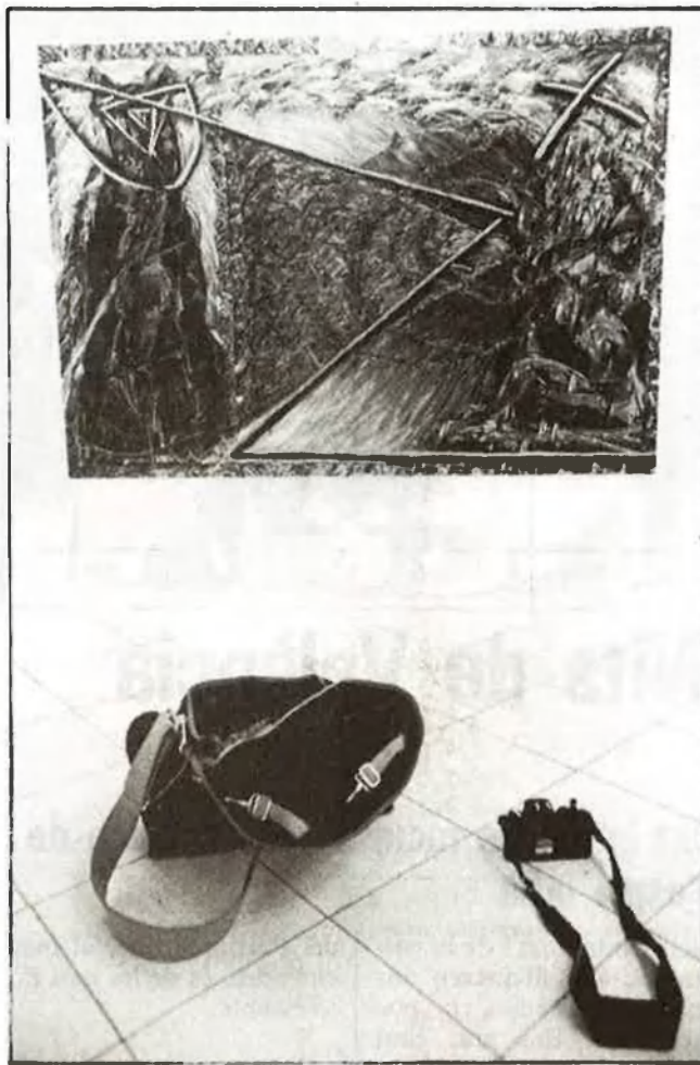
Una mostra que recull l'aportació estètica de setze pintors