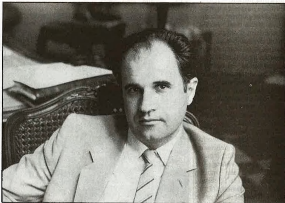
«La Televisió Valenciana ha de ser una alternativa a les dues que funcionen avui»

«La Televisió Valenciana hauria d'acabar tenint una programació totalment en valencià»