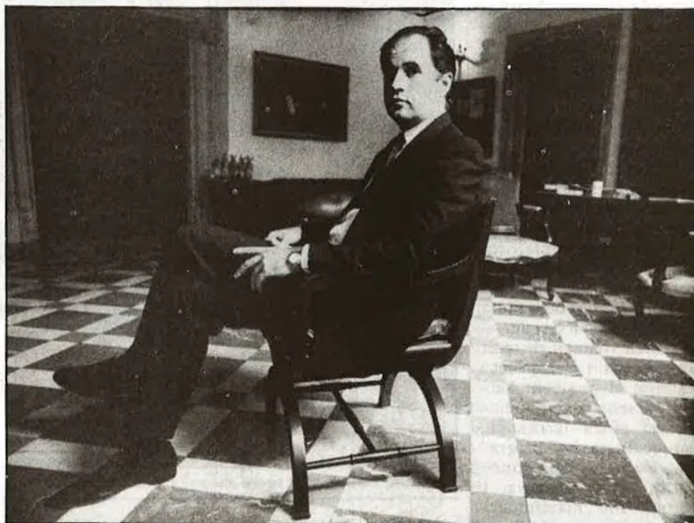
«Haurem d'arribar a una televisió monolingüe, en valencià»

R.- Tot i que en alguns mitjans han aparegut alguns càlculs, vull dir-li que jo mai no he concretat què costarà aquest projecte. I no ho he concretat, perquè no és fàcil saber-ho. Sabem què han costat les televisions d'Euskadi i de Catalunya, però el nostre