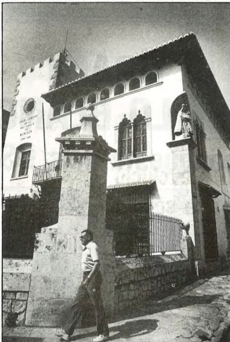
La Casa Comuna de la Séquia de Montcada

en comptes aliens a la Reial Séquia de Montcada. De fet, l'aparició de llibretes obertes posteriorment per a justificar diners cobrats abans i set o vuit milions de pessetes derivats cap a comptes particulars, foren les dues causes fonamentals de la proposta d'expulsió del secretari i el tresorer que el president feu a la junta.