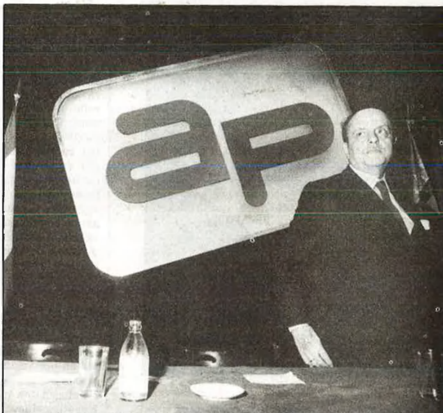
Manuel Fraga Iribarne; on hi ha patró...