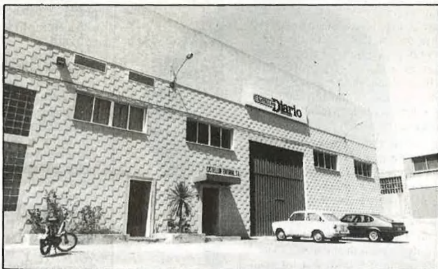
Prensa Canaria donà la sorpresa aterrant a «Castellón Diario» /