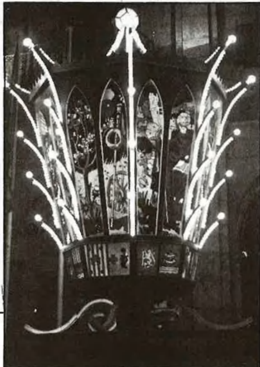
(GERV, 5-3). Gaiata de Castelló: l'estranya metafòrica de fanal en falla

Segurament, pensaven molt més en la gresca i el rebombori que no en el pobre sant Joan, traïdorament degollat, i que allà al cel no sé si devia apreciar massa aquesta mena de commemoracions. Sant Joan o sant Josep o sant Antoni, o hivern, primavera i estiu, això de