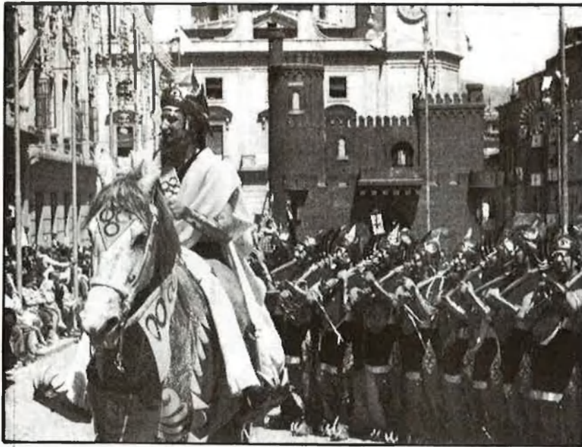
(GERV 1-136). «Fila» alcañina: organització al mil·límetre

F a cosa de seixanta o setanta anys, la vespra de Sant Joan, la bona gent d'Alacant practicava encara amb entusiasme un vell costum: es reunien als terrats de les cases, a les hortes del voltant de la ciutat, a la platja, a menjar-se la coca fullada. I mentrestant llançaven coets, encenien bengales, i pels carrers cremaven multitud de fogueres que els xiquets animaven llançant-hi l' estoreta velleta i tot el material combustible que podien trobar. «Y en las calles cruzábanse los grupos de hombres y mujeres con música de guitarras y bocinas. Un humo pesado y acre iba invadiendo la ciudad, apestando a paja y a esparto quemado», escriu don Rafael Altamira, il·lustre polígraf local. Deu ser per això que la major part dels alacantins encara parlaven valencià. El fum d'espart i de palla.