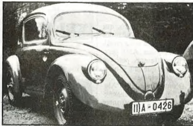
Així de llustrós estava el primer VW

del Golden Arrow, que havia batut el rècord de velocitat en terra el 1929. Els semblà que l'escarabat Porsche era una ximplera ( nonsense ) i que la seua producció no tenia cap futur. Siga com siga, se n'autoritzà la producció «per tal d'evitar un major deteriorament industrial i psicològic» d'Alemanya.