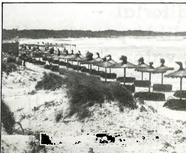
La platja d'Es Trenc, un punt de conflicte