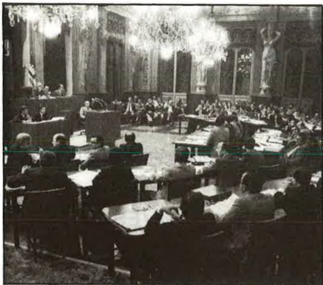
Sala de sessions del Parlament Balear