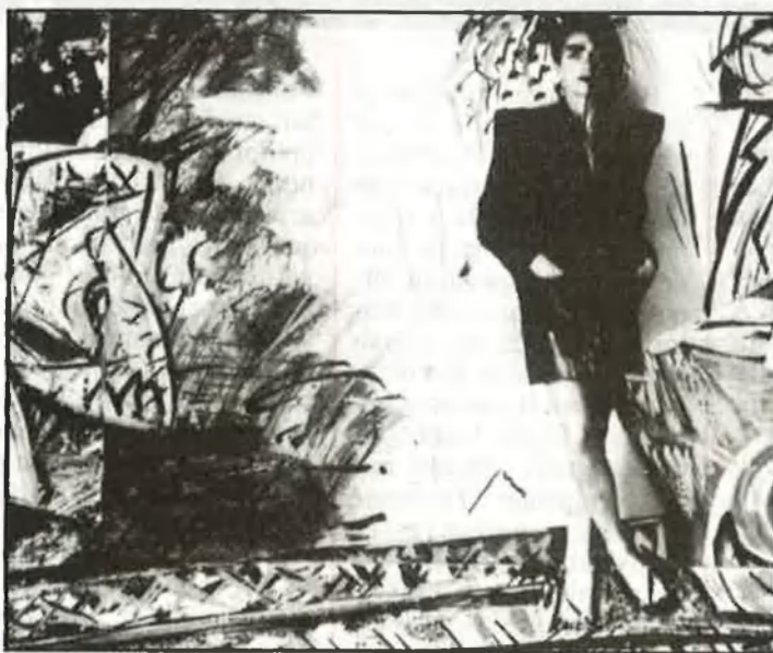
Targeta d'invitació per a l'exposició de Francesca Llopis: «Maquinista»