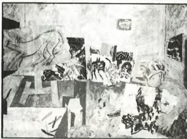
«L'atóm» (1982), de Miquel Barceló. Pigments i oli damunt cartó

Però l'eclecticisme d'aquesta pintura no es redueix als materials. A les exposicions més recents, totes col·lectives, hi trobem pintors que retornen al figurativisme barroc, —àngels trompeters i inspiracions mitològiques—, d'altres que van més enrere i, amb colors diferents, repro-