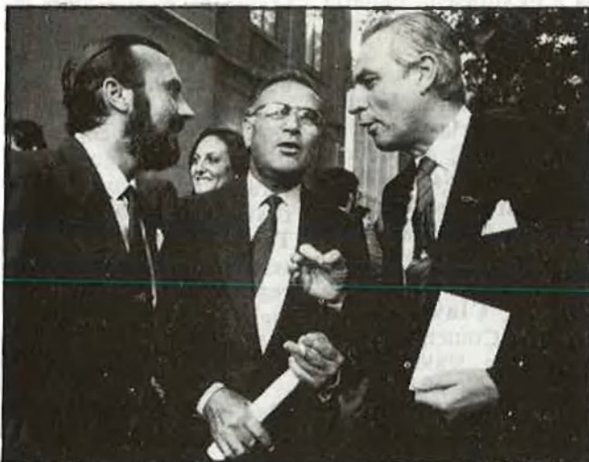
La dreta valenciana tingué dificultats d'accés al Palau