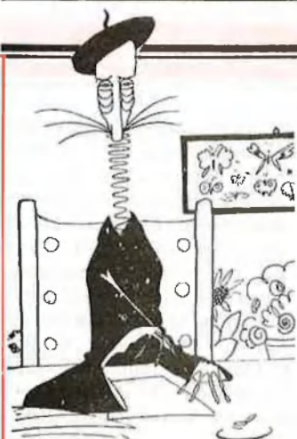
El dramaturg Àngel Guimerà

exiliat i absolutament decebut de tot, amb més raó que un sant. Ara, tot això era producte d'un fet: Bagaria era un home intel·ligent, càustic, enormement hàbil per a captar el sentit de les coses. Segons Pla,