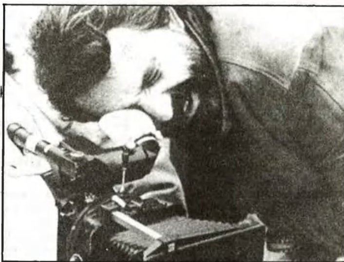
Bruno Ganz, protagonista de «En la ciudad blanca» i el director Alain Tanner