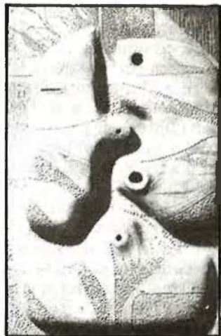
L'experimentació, emprada per a contrar coses

P.- ¿Com veus la marxa del nostre poble, la seua recuperació cultural, lingüística...?