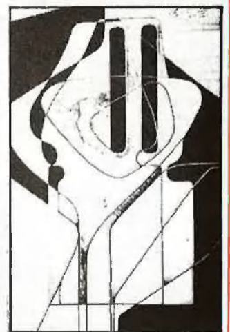
El dibuix, una part de l'aproximació a la forma

P.-En aquest sentit, tu dius que fas «arquitectures contra la por». ¿Contra quina por es defensa Arcadi Blasco?