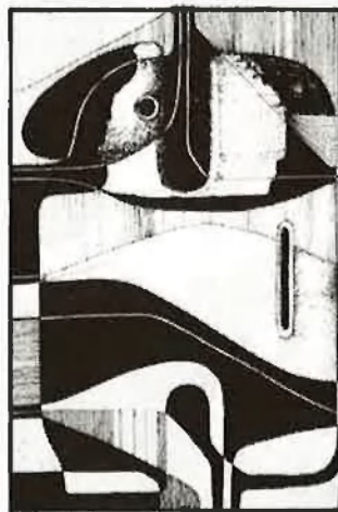
Una formació pictòrica

R.-La meua formació és de pintor. Jo vaig estudiar Belles Arts a Madrid, i a València, a l'Escola de Sant Carles, i, després, he tingut contactes amb molts llocs: Segòvia, Conca, Agost; he treballat directament el fang amb distints professionals, i amb els terrissaires. El contacte ha