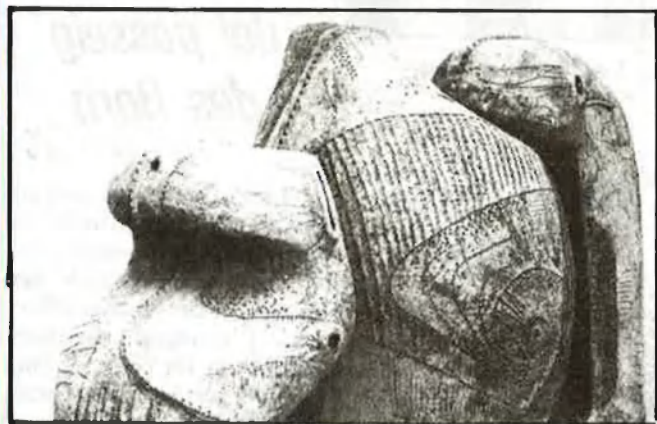
Arquitectures contra la por

tracte, d'alguna forma, no d'oferir respostes, defenses reals, sinó d'ironitzar sobre la mateixa por. No hem de tindre aquesta por, sinó que hem de revestir-nos d'equilibri, d'invitacions al diàleg; hem de traure fora tota la part ne-