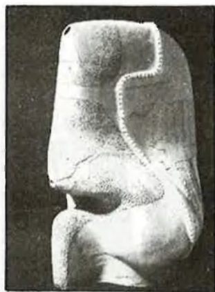
El treball a partir de materials ceràmics

Crec que la por ha estat el condicionament que ha impulsat el naixement de la cultura. L'home ha tingut por, en primer lloc, de la terra, de la solitud, del foc, dels altres animals, dels altres hòmens, de la foscor, i, per això, s'agrupa. I l'afany de llevar-se la por ha produït la cultura, unes defenses contra la por que han atribuït uns valors màgics als objectes més enllà de la mateixa naturalesa; així, un tros de fusta d'un arbre o una ploma de pardal no han estat mai una fusta o un pardal, al