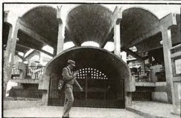
(De dalt a baix). Oficines de la policia municipal d'Algemesí, una font de problemes, i la patrulla del «centre comercial», que respon a un concepte renovador de la policia / A.