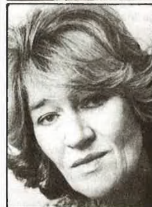
El professor Jan Tinbergen (dalt) i la parlamentària britànica Jane Ewart-Biggs

Europa. Les opinions de dos polítics en actiu, un intel·lectual conegut i un escriptor d'èxit, ajuden a situar les qüestions. El silenci de la major part de la nostra premsa sobre aquestes eleccions, no deixa de ser ben expressiu. Tots els enquestats coincideixen en el fet que el Parlament Europeu està molt lluny de ser el que caldria. Ara, cap dels quatre no invalida la institució; tots demanen que sigui reforçada. ¿Eleccions al Parlament Europeu? ¿La lluna? Parlem de l'eclipsi. Que, d'altra banda, no vam poder veure.