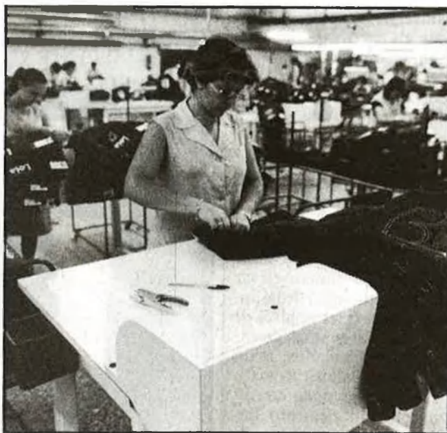
El tèxtil, on més clara apareix la reconversió

La reconversió en matèria siderúrgica ha afectat el País Valencià (AHM, ubicats al Camp de Morvedre) d'una forma peculiar. En el fons de la qüestió hi ha el canvi efectuat pel govern de Madrid respecte a l'acord sobre sanejament i reconversió del sector siderúrgic integral: el Reial Decret 1.853/1983, de 6 de juliol, pel qual es descarta