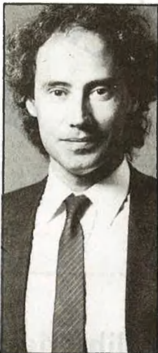
El conseller ha dissenyat la seua política / Francesc Ciscar

En definitiva, el programa no aborda aspectes com l'associacionisme cultural o la política en relació a l'empresa i la infraestructura cultural privades, no fa referència als problemes específics dels artistes i els intel·lectuals, i