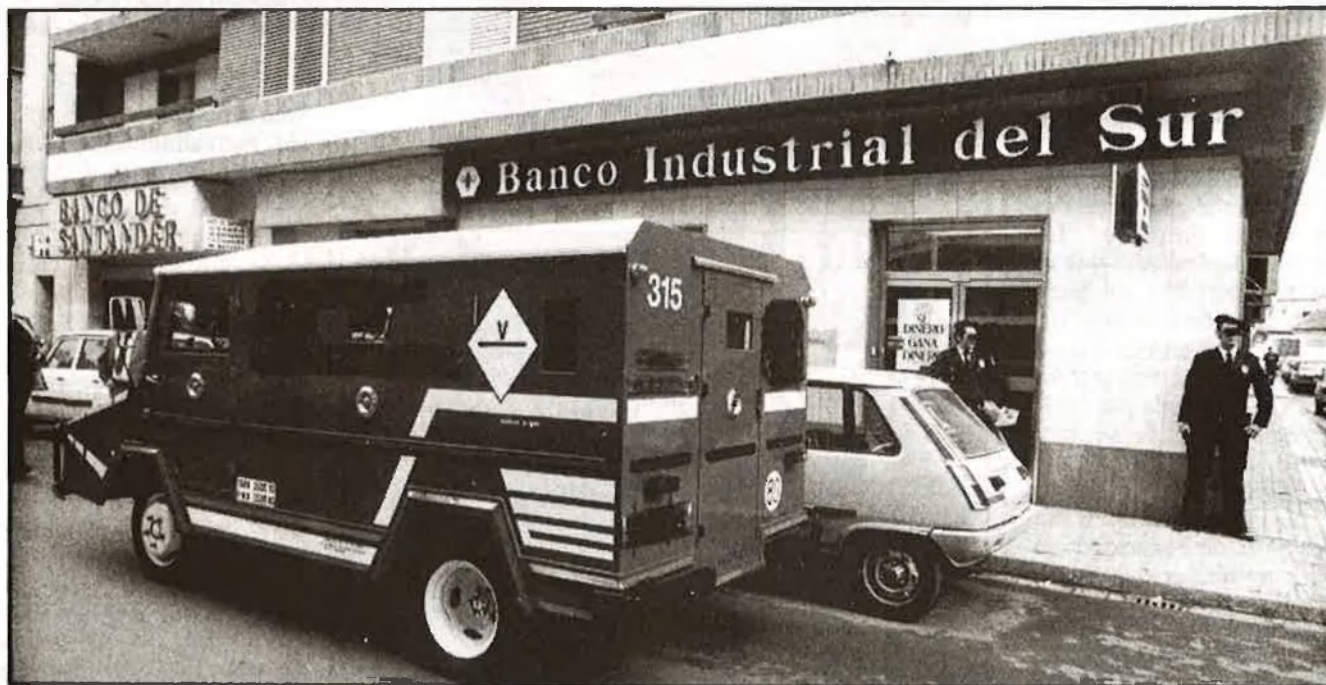
La banda dels «Larios» tenia planejat assaltar un furgó blindat