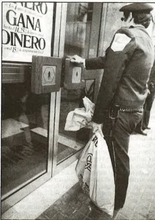
L'ofici de transportar bitllets és una professió arriscada / Francesc i Casar

Contracte d'arrendament pel qual l'empresa Euroblins custodiarà Nuevo Centro durant l'any 1984