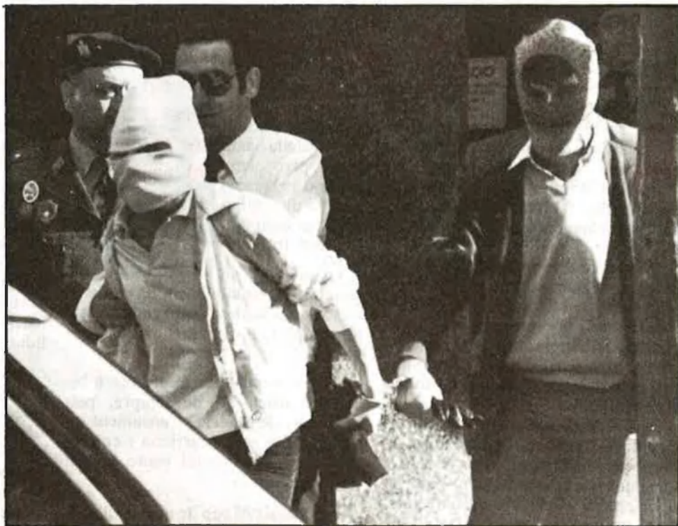
Un final que no sempre és el mateix

La crisi és una paraula que no entra al vocabulari de les empreses de seguretat. El 1984, aquestes empreses mobilitzaran un capital aproximat de 70.000 milions de pessetes i crearan 1.500 nous llocs de treball, segons les dades oficials. Això sense comptar l'expansió que es produirà pel que fa a les empreses d'economia submergida, una garbera, segons fonts oficials. Tot aquest optimisme creatiu està molt bé, sempre que els portadors de la Llama-38 no siguin angelets de la mena que hem descrit anteriorment, que embruten la imatge dels que trobaren en aquest sector una eixida per a l'angoixant atur que patien. «Si demà m'oferiren un treball diferent, l'acceptaria; no és cap plaer notar-te un revòlver al cintó. Al contrari del que pensa la gent, els vigilants-jurats ens trobem molt incòmodes; a més, la família estaria més tranquil·la», confessa un vigilant amb cinc anys d'antiguitat a la professió.