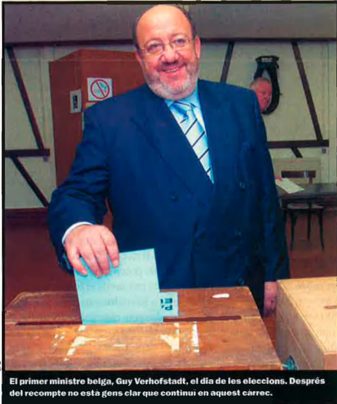
El primer ministre belga, Guy Verhofstadt, el dia de les eleccions. Després del recompte no està gens clar que continui en aquest càrrec.